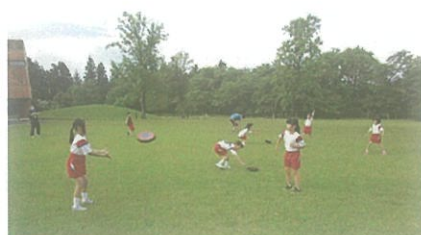
5月31日の教室の様子 フリスビーをしました(^^♪

さまざまなスポーツやあそびの中で、あいさつやマナー、 ルール的重要性を重点的に学びます。また制作などの文化活動も行いますよ！ ぜひお問い合わせください！！